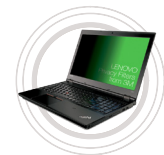
Filtres de confidentialité Lenovo™ par 3M™