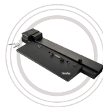
Station d'accueil pour station de travail ThinkPad®